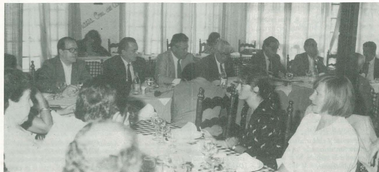
Presidencia de la Asamblea del PSR

Vista la incapacidad y descomposición de los partidos políticos, la Revista COMARCA DEL MONTSIA ofrecerá a sus lectores y amigos el programa ideológico del PARTIDO SOCIAL REGIONALISTA, con el propósito de actualizar sus siglas, con fórmulas nuevas y un ideario institucional, social y popular, capaz de servir con eficacia y buena voluntad al pueblo español.