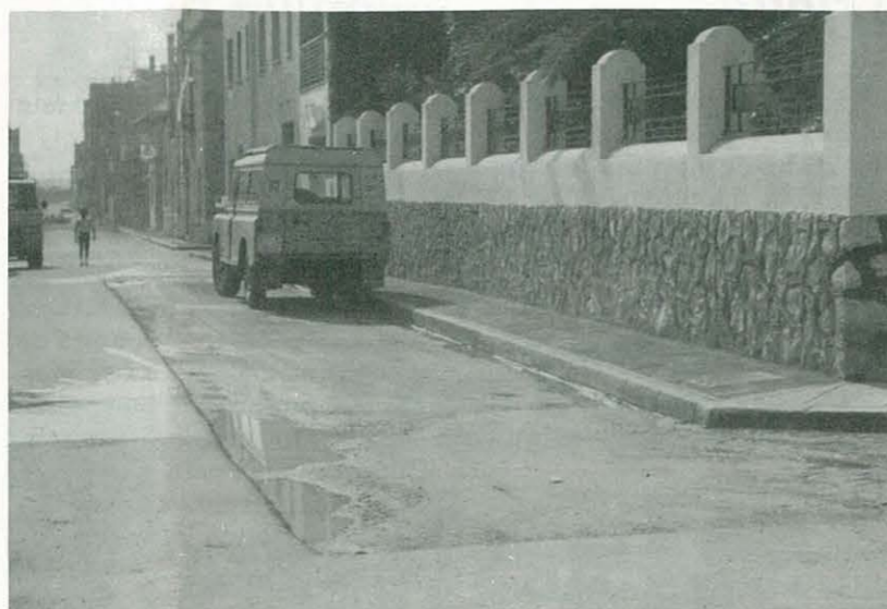
Tramo de la calle Entenza que no fue asfaltado por ausencia del propietario

nos meses oiremos que, con todo descaro y el «morro» que se pueda echar, nos recuerdan que los socialistas asfaltaron las calles de toda la población. No sería de extrañar que en algún mitin de la campaña para las elecciones municipales, alguien, al oír tal falacia y ver tanto cinismo, no pudiera contenerse y soltara su «do de pecho» gritando: ¡arribistas! ¡Mentirosos! ¡Y una porra! Porque debemos disipar toda duda acerca de la realidad intrínseca de los hechos, aunque a más de uno pueda parecerle inconcebible y contra toda ética —esa ética socialista parangonable a la mayor antiética— que nuestros «bienhechores» se apropien del tema con fines demagogos y partidistas, cuando lo único que han hecho ha sido enredar las cosas con cara dura y engañar al pueblo.